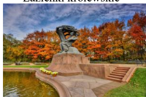
Pomnik F. Chopina

1 dzień: Wyjazd w godzinach porannych (do ustalenia), przejazd do Warszawy . Zwiedzanie miasta: Cmentarz Stare i Nowe Powązki . Zwiedzanie Muzeum Powstania Warszawskiego* . Obiadokolacja. Przejazd do hotelu, zakwaterowanie i nocleg.